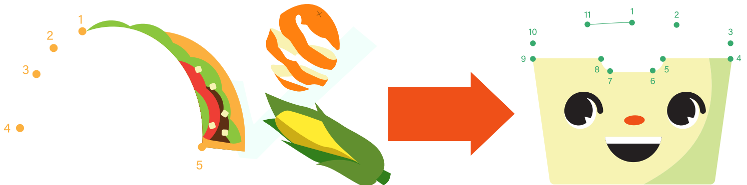
Food Scrap Container

Complete this Connect the Dots activity to reveal some of the food scraps that you should collect! ¡Conecte los puntos para revelar algunos de los restos de comida que debe recolectar!